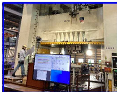
工場に設置された大型モニターで 日程や進捗状況を確認