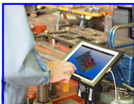
工場では1人1台の タブレットで金型を製作